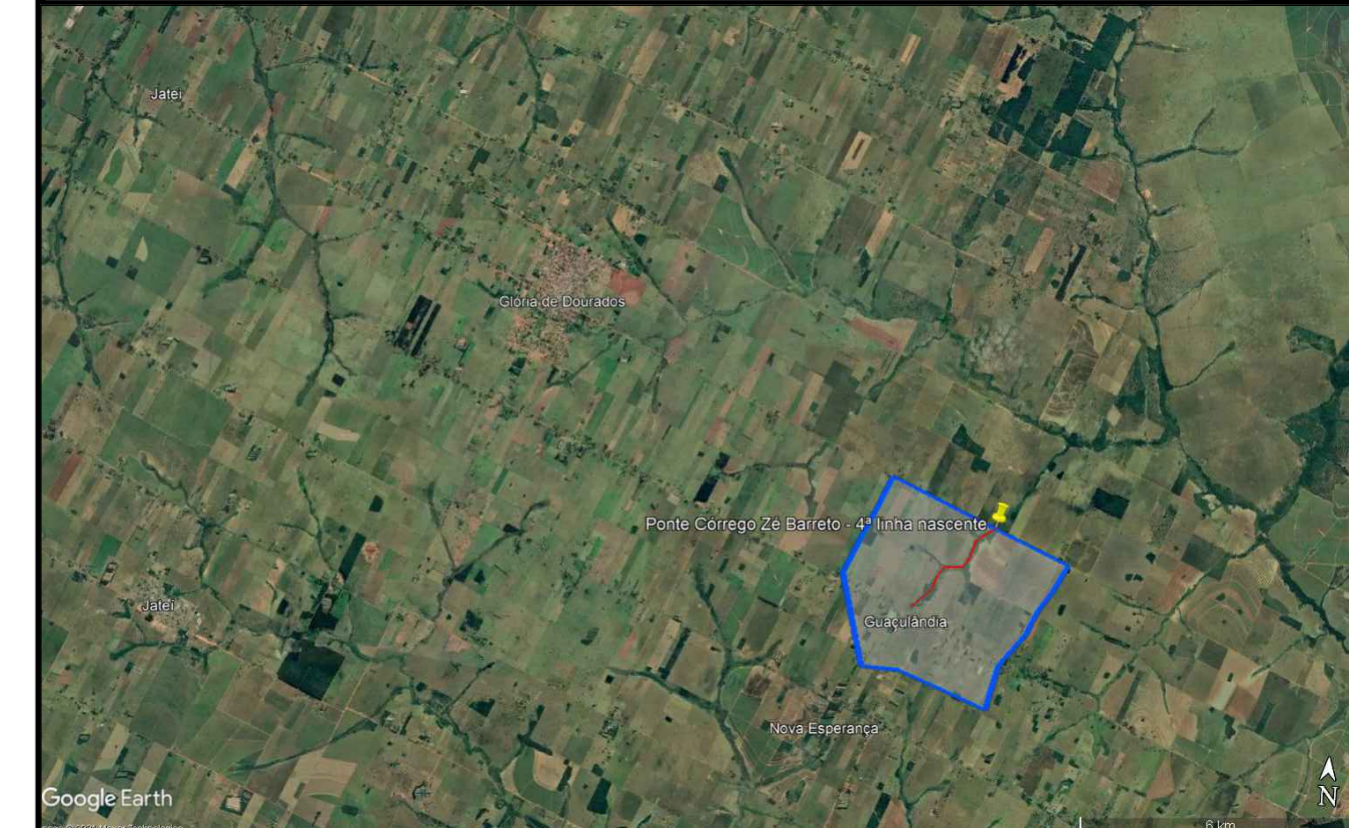
LOCALIZAÇÃO EM RELAÇÃO AO PERÍMETRO URBANO S/Esc

Projeção UTM - Fuso 21 Sul Datum: SIRGAS 2000