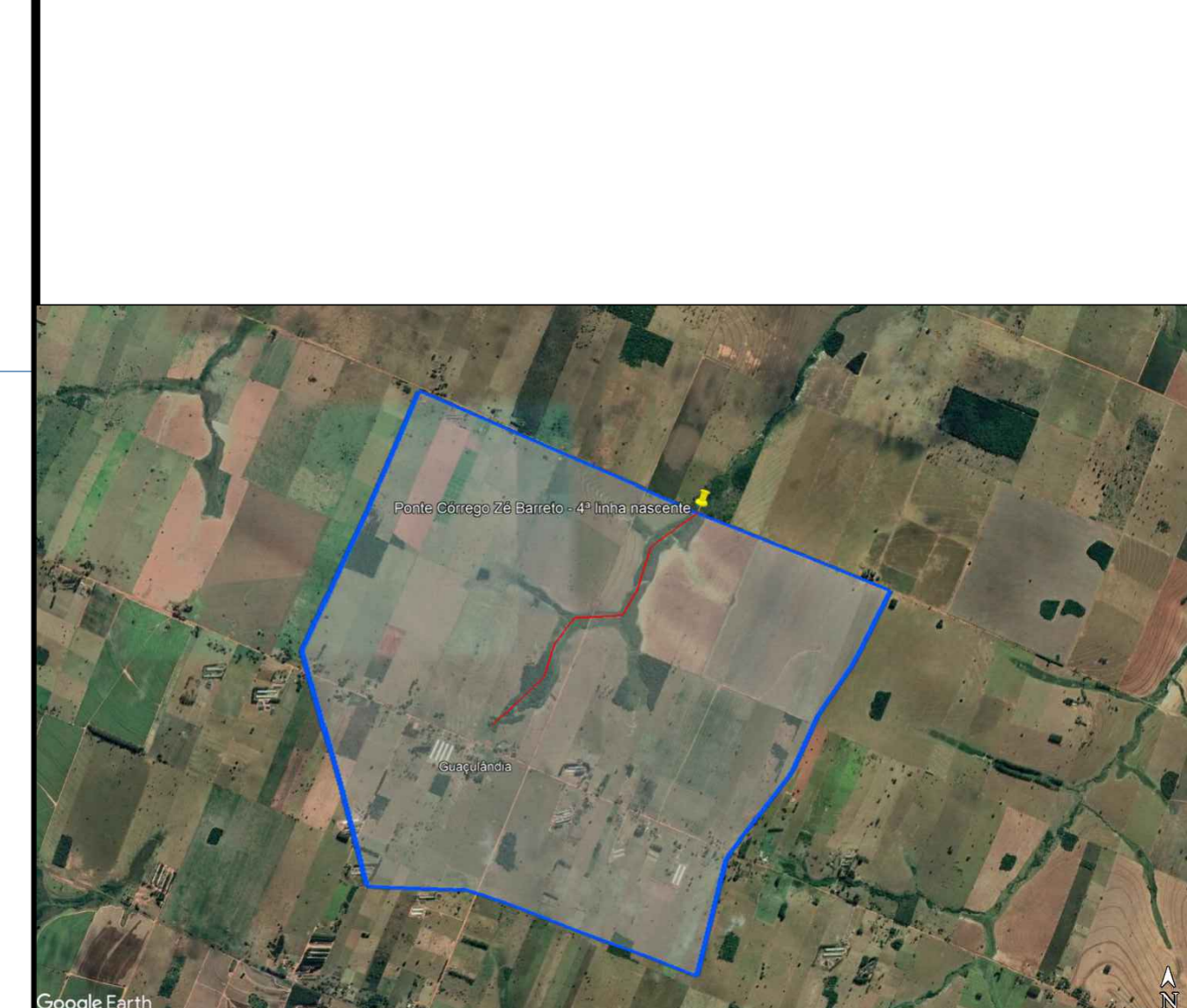
BACIA DE CONTRIBUIÇÃO DA PONTE S/Esc

PERÍMETRO URBANO DE GLÓRIA DE DOURADOS 22°25'3.44"S 54°13'51.14"O